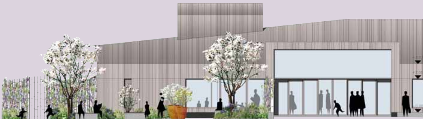
La bibliothèque s'ouvre très largement sur la place de la Libération grâce à une façade vitrine.