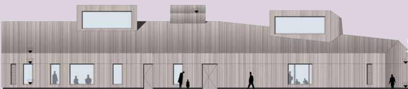
Du côté de la rue de Forsfeld, la façade s'ouvre ponctuellement avec des cadrages très rythmés sur l'ancien bourg.