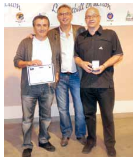
La médaille du District

Autre reconnaissance qui fait, elle aussi, la fierté du club : le label qualité FFF Adidas a été renouvelé à l'Ecole