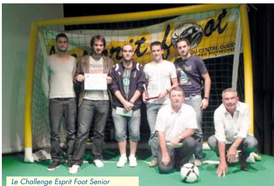
Le Challenge Esprit Foot Senior

Plus de 80 personnes avaient répondu à l'invitation du Club. Après un succulent repas offert par l'USAC et dégusté sous un chaud soleil s'est disputé un concours de pétanque où joie et saine détente ont prévalu.