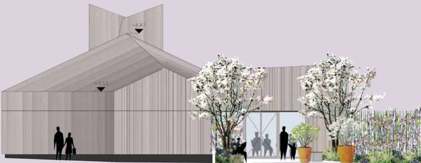
La capacité du projet à dessiner l'urbain et à le structurer réside dans la définition des pleins et des vides mais aussi dans la définition des limites (traitement des façades, proportions, percements, rythme, matérialité). L'école de musique est conservée car elle est un élément structurant, urbain et culturel. Le dialogue entre l'école de musique, l'église et la bibliothèque s'établit grâce à un jardin cloître.